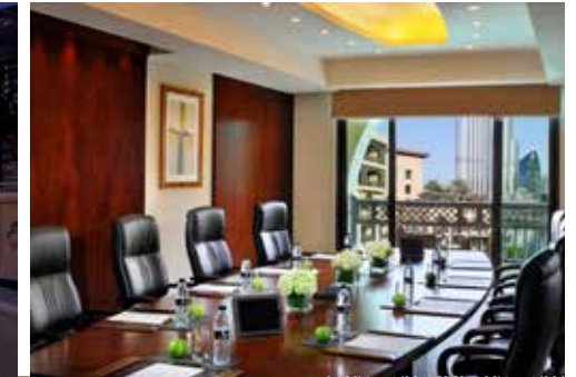
LEISTUNGEN UND EXTRAS

Unabhängig davon, ob feierlich oder geschäftlich, inmitten der arabischen Pracht des Palace Downtown lassen sich alle Arten von Events realisieren. Anlässe von persönlicher Bedeutung, wie z. B. Hochzeiten, Jahrestage, Geburtstage und intime Abendessen sowie Unternehmensveranstaltungen und Trainingsprogramme hinter verschlossenen Türen werden perfekt vorbereitet und wir legen an all unseren Veranstaltungsorten großen Wert auf Detailtreue.