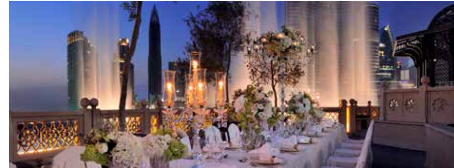
MEETINGS UND EVENTS

Im Hotel bietet ein komplett ausgestattetes Fitness-Studio private Trainingseinheiten zu Vorzugspreisen und die Gäste können an einer Reihe von Aktivitäten und Kursen teilnehmen, die darauf ausgerichtet sind, Sie dabei zu unterstützen, den idealen Fitnesszustand zu erreichen und beizubehalten.